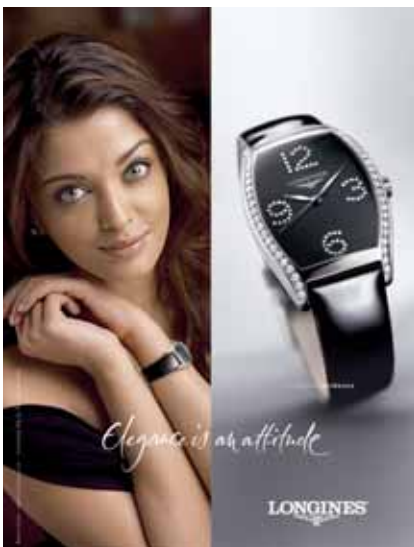
«Longines Evidenza: Ein bildhafter Name, der symbolische Aussagekraft in sich trägt, mit zeitloser, ausgesuchter Eleganz, die die Longines-Welt perfekt mit einer kleinen, etwas impertinenten Spitze bereichert und damit genau den Unterschied schafft, auf den es ankommt.»

on vor den Mitbewerbern geschützt werden. Dafür muss die Marke – Wortmarke oder grafische Marke – beim Institut für geistiges Eigentum in Bern registriert werden. Dies gilt für Marken von Unternehmen mit Sitz in der Schweiz und für internationale Marken, die zuerst in der Schweiz und danach in allen anderen Zielmärkten eingetragen werden. Es empfiehlt sich jedoch, zuerst deren Verfügbarkeit abzuklären, um sicher zu